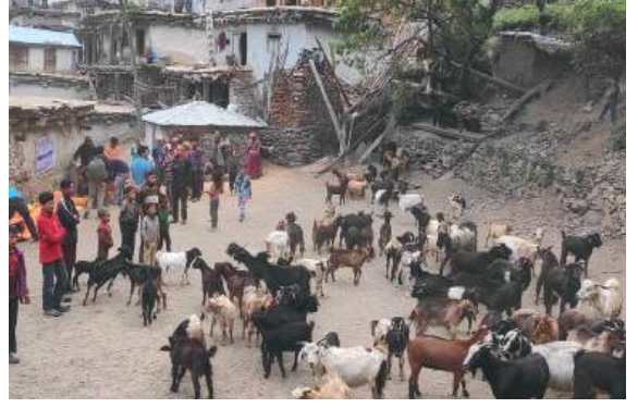
पशु स्वास्थ्य शिविर/परजिवी नियन्त्रण/आकस्मिक उपचार