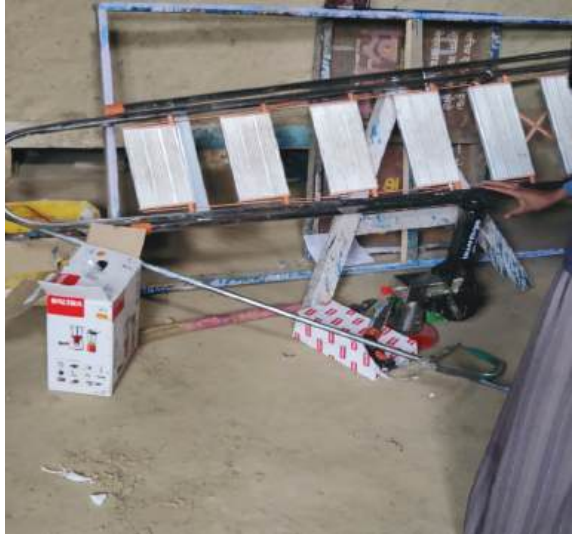
साना कृषि मेसिनरी औजार/उपकरण