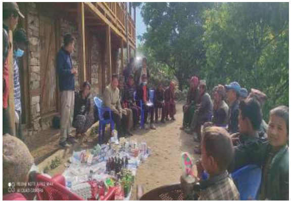
पशु स्वास्थ्य शिविर/परजिवी नियन्त्रण/आकस्मिक उपचार