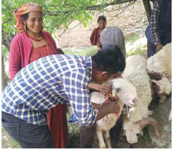
नशल सुधार कार्यक्रम