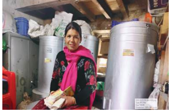
प्याकेजिड तथा लेबलिड