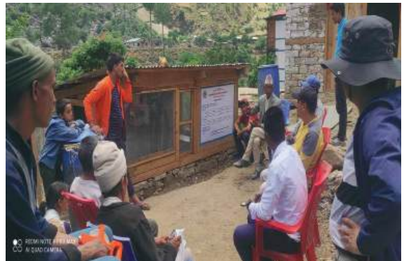
स्वच्छ मासु पसल स्थापना